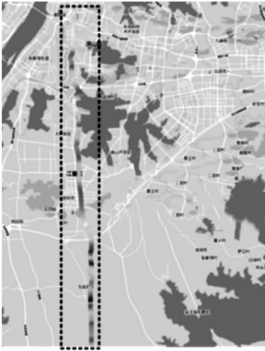
图2 110 kV 输电线路沿线接地电阻分布热力图

地参数历史测量数据进行了统计分析,并按所提出的风险分级方法进行了计算分析。全线测量接地电阻大小的分布如图2所示。