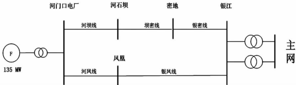
图2 四川某地区部分 110 kV 电网结构图

(输电线路、母线、主变压器)均配置了能保证快速性、选择性的专用纵联或者纵差动保护。正常情况下,河石坝变电站母线桥 113 断路器处于运行状态,两台主变压器高压侧并联运行,分别承担 40 MW 负荷;当河石坝 110 kV 1M 故障,主变压器 1B 差动保护快速动作使 1B 中、低压侧,以及 151、113 断路器跳闸,确保了电网稳定运行。