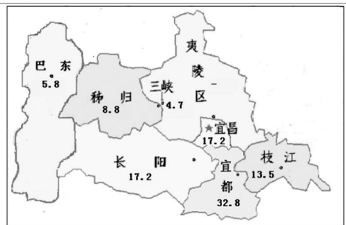
图 3 多年年均大雪概率空间分布

2004 年底至 2005 年春 500 kV 三龙 I、II、III 回以及万龙 I、II 回等三峡出线由于受雨雪、雨淞等恶劣天气的影响,出现了地线支架屈服、地线滑移掉线、导线严重断股、绝缘子覆冰闪络等线路故障,造成了部分线路设备损坏和多次中断送电,严重威胁电网安全运行。2008 年 1 月,宜昌地区再次遭遇大范围大强度的暴风雪,三峡出线出现线路冰闪两次、地线防振锤损坏等故障。针对这两次冰灾事故,进行了地线